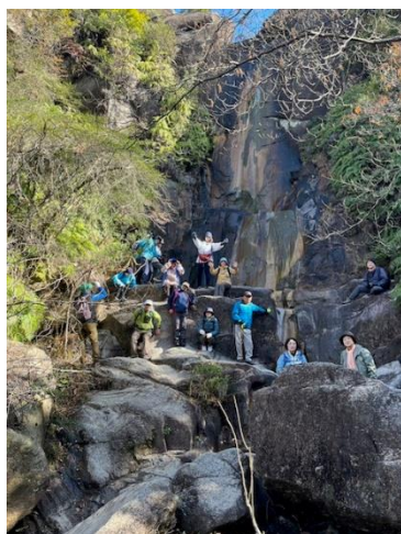
昨年度のハイキング&自然観察会

主な活動は、オランダ堰堤周辺やキャンプ場の清掃活動です。(5月～10月の日曜日夕方実施)